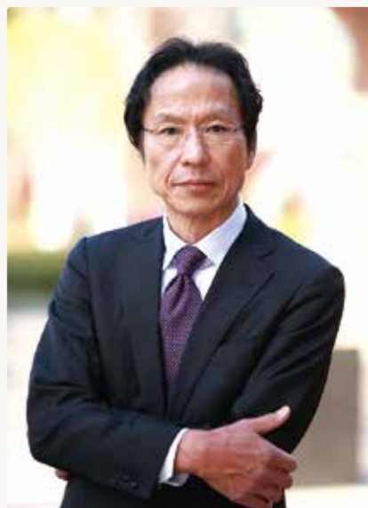
姜 尚中(カン サンジュン) 1950年、熊本県熊本市に生まれる。国際基督教大学准教授、東京大学大学院情報学環・学際情報学府教授、聖学院大学学長などを経て、現在東京大学名誉教授。2016年1月より熊本県立劇場館長兼理事長に就任。専攻は政治学、政治思想史。テレビ・新聞・雑誌などで幅広く活躍。主な著書に「マックス・ウェーバーと近代」「オリエンタリズムの彼方へ」「悩むわい」など。最新刊は「君に伝えたいこと」。

私は今後、館長としてこうした劇場の役割をもっと押し上げられるよう、県民の皆さんと一緒にそのミッションを果たすべく、努力していきたいと思ひます。