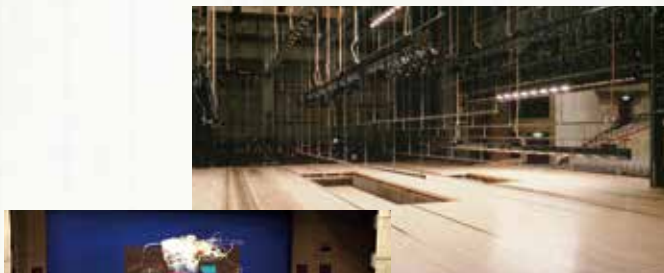
改修する舞台機構等

例えば、これまでは吊物のパネルや幕類の高さを記憶・再現する機能がなかったため、手動ボタンへの吊り替えや演出内容を変更していただく等、舞台を進行するうえで、利用者の皆様へご不便をお掛けしておりました。改修後は高さの記憶、昇降スピードの可変、機構の静穏化が可能となり、仕込み時間の短