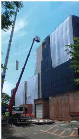
取り外し中の外壁PC板